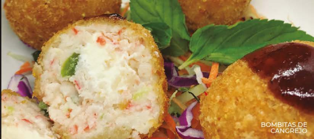
BOMBITAS DE CANGREJO