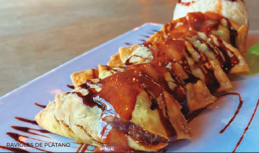
RAVIOLES DE PLÁTANO