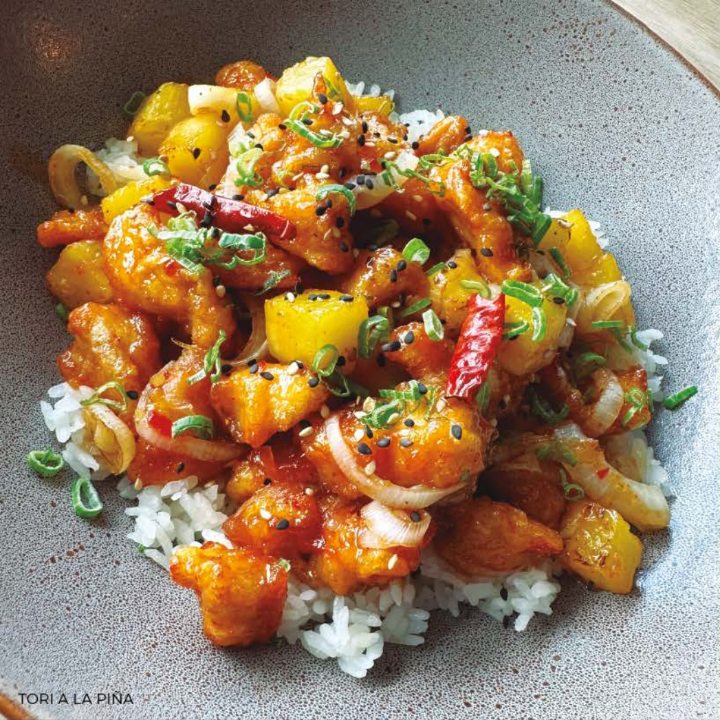
TORI A LA PIÑA