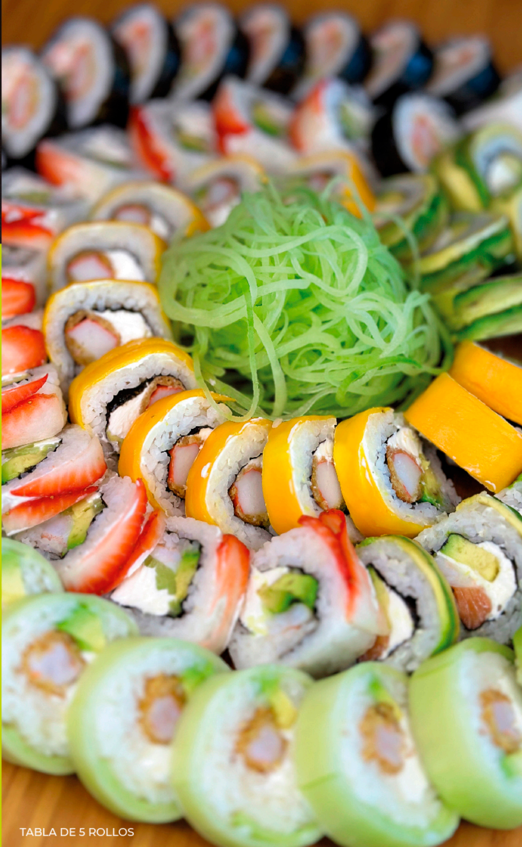
TABLA DE 5 ROLLOS

5 ROLLOS DE TU ELECCIÓN + UN ROLLO GRATIS