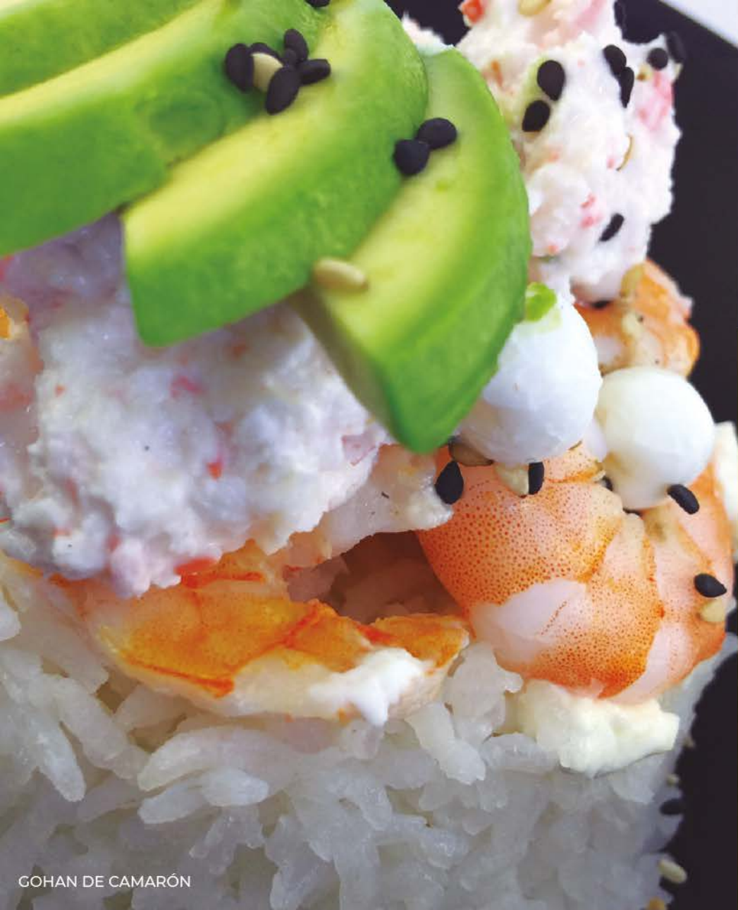
GOHAN DE CAMARÓN