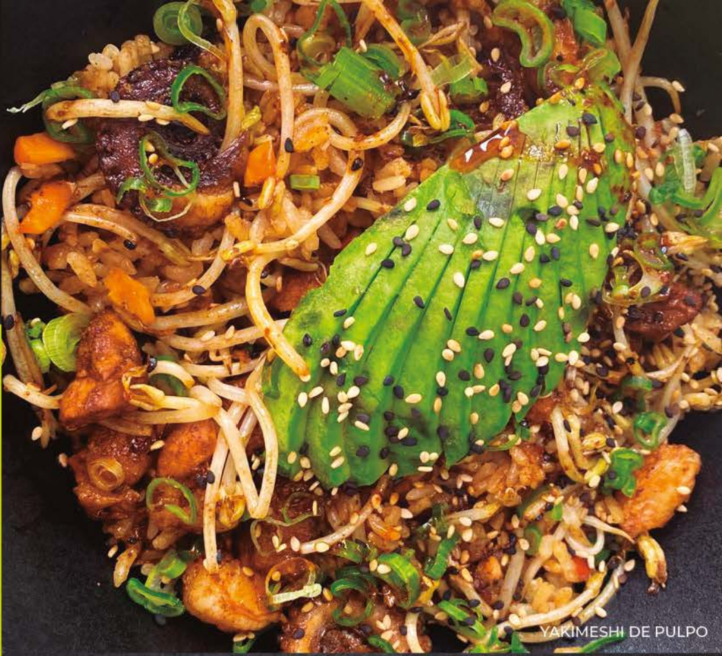
YAKIMESHI DE PULPO