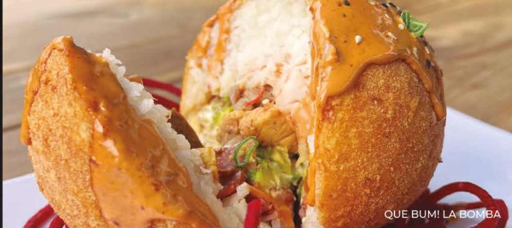
QUE BUM! LA BOMBA

ESFERA DE ARROZ SUSHI ACOMPAÑADAS DE TAMPICO Y SALSA CHIPOTLE, RELLENAS DE PHILADELPHIA Y AGUACATE. ELIGE TU PROTEÍNA: